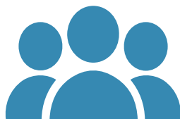
GZS SRIP ToP TIM

Vodi proces in aktivnosti RČV za SRIP ToP